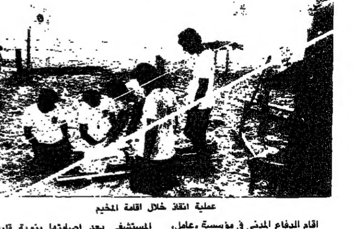
عملية انقاذ خلال اقامة الحميم

اقام الدفاع المدني في مؤسسة عامل، مخبها جريما للاستشفاء والانقاذ... اشعلت نشبته انفجار ثمة الخياط